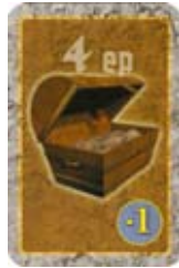
Bloedschat Trek -1 van je verplaatsing af. Je kunt het niet achterlaten, tenzij je de juiste Bezwinging hebt.