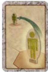
Teleporteer jezelf naar het middenvakje van een Kamer.