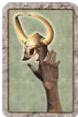
Steel de Helm van een andere speler.