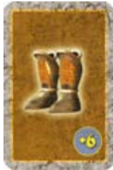
Runesokken Doe +6 bij je verplaatsing. Afleggen na gebruik.