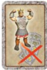
Verwijder al je verkregen RIPpunten.