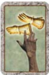
Steel de Handschoenen van een andere speler.