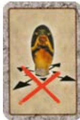
Blokkeer het Monster, hij kan zich niet verplaatsen.