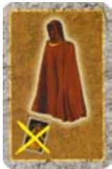
Runemantel Elke Monsterkaart heeft geen effect op de Held.