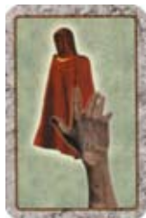
Steel de Mantel van een andere speler.