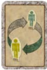
Wissel je pion om met die van een andere speler.