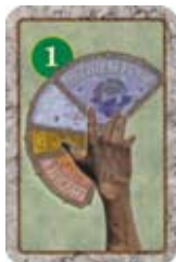
Steel een Amuletdeel van een andere speler.