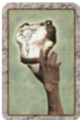
Steel het Pantser van een andere speler.