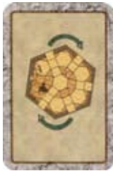
Roteer een Kamer naar jou keuze.