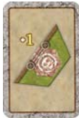
Voeg er een Ingang toe.