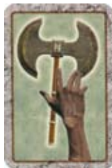
Steel de Aks van een andere speler.