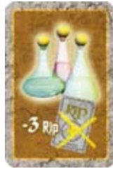
Genezingsdrankje Neem 2, 3 of 4 RIPpunten weg.