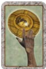
Steel het Schild van een andere speler.