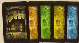
32 Kleine locatiekaarten (4 sets van 8 kaarten in elk van de spelerskleuren)