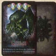
6 "Grote Oudere"-kaarten